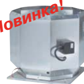
Взрывозащищенные вентиляторы 228-231