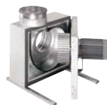
Кухонные вытяжные вентиляторы 157-171

AW/AR AXC, AXG, AXC-B Расход воздуха 1080-270000 м³/ч