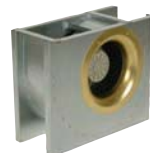
Взрывозащищенные вентиляторы 232-235