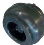
Взрывозащищенные вентиляторы 206-217

DVC, MUB..EC Расход воздуха 930-11410 м³/ч