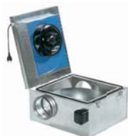
Шумоизолированные вентиляторы для круглых каналов 40-53

KVO, KVK, KVKE Расход воздуха 180-3000 м³/ч