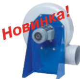
Другие вентиляторы 250-255

BF, CBF, IF, PRF Расход воздуха 36-6560 м³/ч