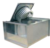
Вентиляторы для прямоугольных каналов 54-67

KVO, KVK, KVKE Расход воздуха 180-3000 м³/ч