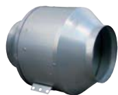
Вентиляторы для круглых каналов 30-39