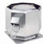
Вентиляторы дымоудаления 172-189

KBT/KBR MUB..K Расход воздуха 820-5030 м³/ч