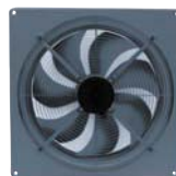
Осевые вентиляторы 136-156

DHS, DVS, DVSI, DVN, DVNI Расход воздуха 360-31680 м³/ч