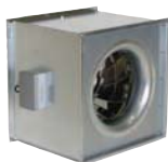
Вентиляторы для квадратных каналов 100-103

KDRE/KDRD Расход воздуха 3600-14760 м³/ч