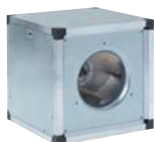
Вентиляторы Multibox 78-99