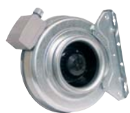
Вентиляторы для круглых каналов 22-29